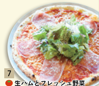
7 ● 生ハムとフレッシュ野菜 ¥1,112 (税込 ¥1,200)