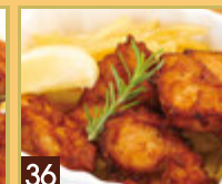
36 チキン唐揚げ & フライドポテト ¥649 (税込 ¥700)