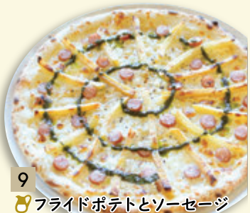
9 🍷 フライドポテトとソーセージ ¥1,112 (税込 ¥1,200)