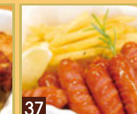
37 あらびきソーセージ & フライドポテト ¥649 (税込 ¥700)