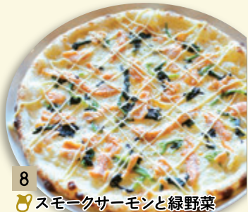
8 🍷 スモークサーモンと緑野菜 ¥1,204 (税込 ¥1,300)