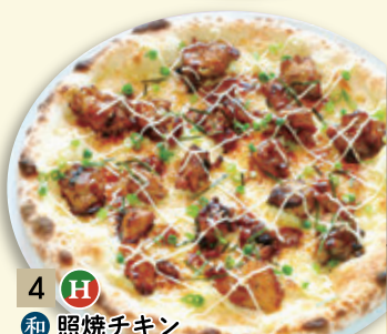
4 H ● 和 照焼チキン ¥1,112 (税込 ¥1,200)