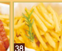
38 フライドポテト ¥417 (税込 ¥450)