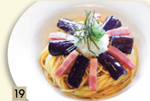
19 なすとベーコンと大根おろし ¥1,319 (税込 ¥1,450)