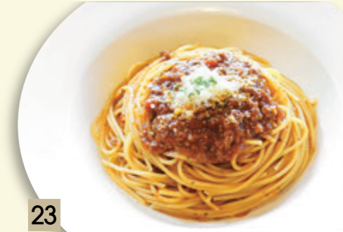
23 シンプルにミートソース ¥1,273 (税込 ¥1,400)