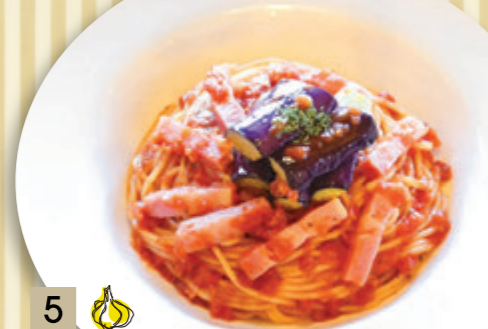
5 なすとベーコンの トマトソース ¥1,364 (税込 ¥1,500)