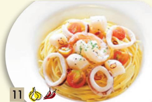
11 海の幸のアリオ・アリオ ¥1,682 (税込 ¥1,850)