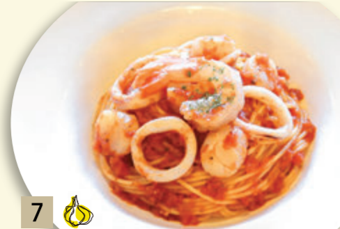
7 海の幸のペスカトーレ ¥1,682 (税込 ¥1,850)