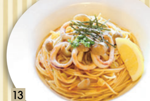
13 イカときのこの明太子和風 ¥1,364 (税込 ¥1,500)