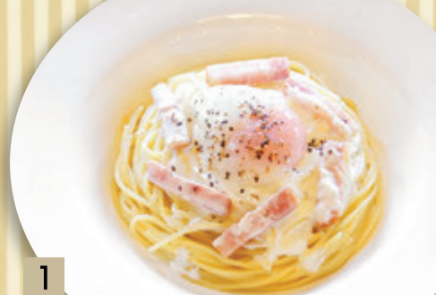
1 とろとろ卵とベーコンの カルボナーラ ¥1,500 (税込 ¥1,650)