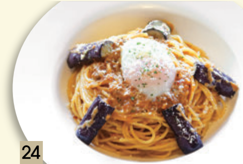
24 とろとろ卵となすの ミートボナーラ(ミート+クリーム) ¥1,455 (税込 ¥1,600)

にんにく入り にんにく、とうがらし入り ★にんにく、とうがらしの量は好みに応じます。