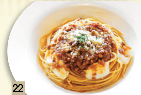
22 モッツアレラとパルメザンの ミートソース ¥1,455 (税込 ¥1,600)