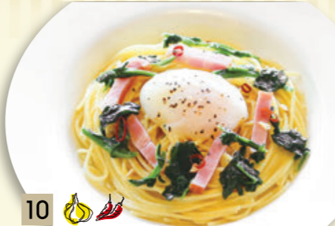
10 とろとろ卵とベーコンの ペペロンチーノ ¥1,319 (税込 ¥1,450)