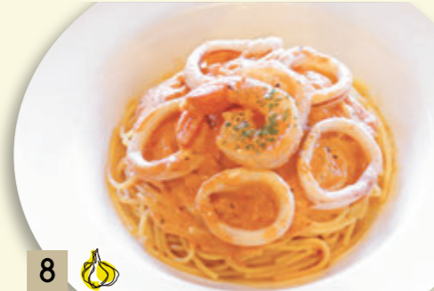
8 海老とイカの トマトクリームソース ¥1,546 (税込 ¥1,700)