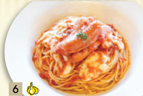
6 ソーセージとモッツアレラの トマトソース ¥1,410 (税込 ¥1,550)