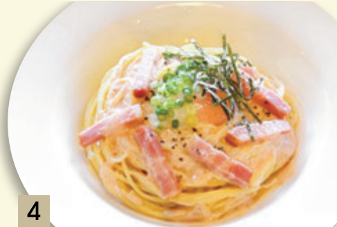
4 とろとろ卵とベーコンの 明太子和風カルボナーラ ¥1,546 (税込 ¥1,700)