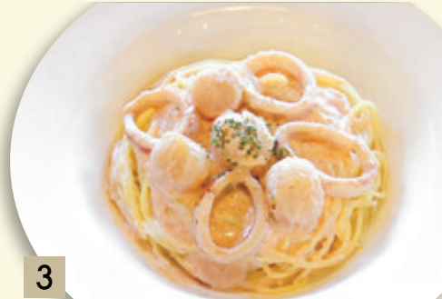
3 ホタテとイカの 明太子クリームソース ¥1,682 (税込 ¥1,850)