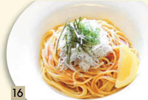
16 ちりめんしらすの明太子和風 ¥1,319 (税込 ¥1,450)