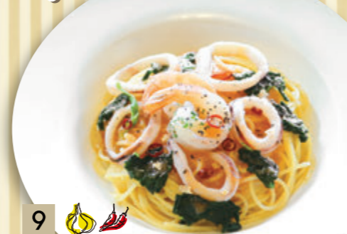
9 海老とイカの 明太子ペペロンチーノ ¥1,546 (税込 ¥1,700)