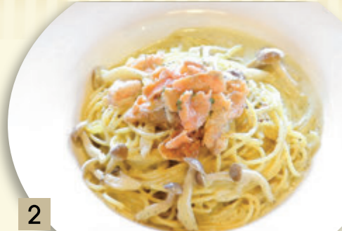
2 スモークサーモンの バジルクリームソース ¥1,637 (税込 ¥1,800)