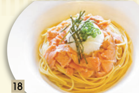
18 スモークサーモンと大根おろし ¥1,410 (税込 ¥1,550)