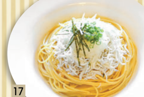
17 ちりめんしらすと大根おろし ¥1,319 (税込 ¥1,450)