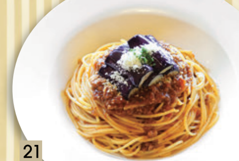
21 なすのミートソース ¥1,410 (税込 ¥1,550)