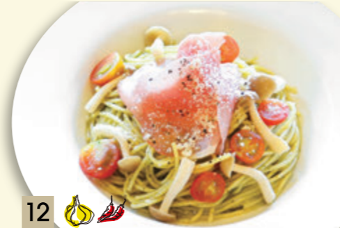
12 生ハムとフレッシュトマトの ジェノベーゼ ¥1,546 (税込 ¥1,700)