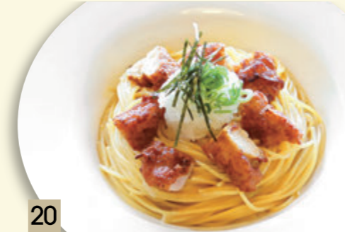
20 チキン唐揚げと大根おろし ¥1,273 (税込 ¥1,400)