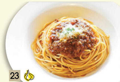
23 🧄 シンプルにミートソース ¥1,273 (税込 ¥1,400)