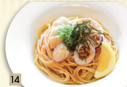
14 ホタテとイカの明太子和風 ¥1,546 (税込 ¥1,700)