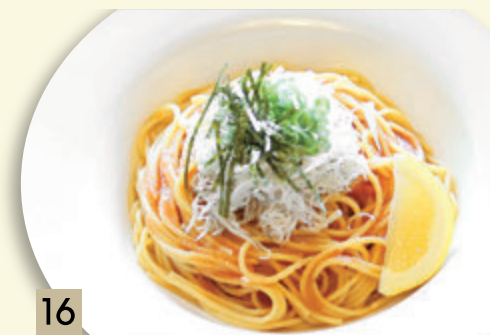
16 ちりめんしらすの明太子和風 ¥1,319 (税込 ¥1,450)