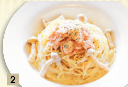
2 スモークサーモンの クリームソース ¥1,591 (税込 ¥1,750)