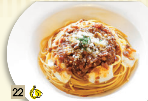
22 🧄 モッツアレラとパルメザンの ミートソース ¥1,410 (税込 ¥1,550)