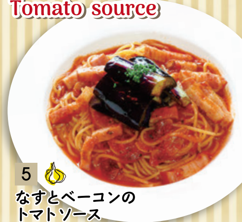
5 🧄 なすとベーコンの トマトソース ¥1,319 (税込 ¥1,450)