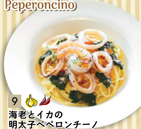
9 🧄🌶️ 海老とイカの 明太子ペペロンチーノ ¥1,500 (税込 ¥1,650)