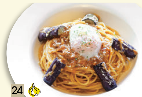
24 🧄 とろとろ卵となすの ミートボナーラ ¥1,455 (税込 ¥1,600)

🧄 にんにく入り 🧄🌶️ にんにく、とうがらし入り ★にんにく、とうがらしの量はお好みに応じます。