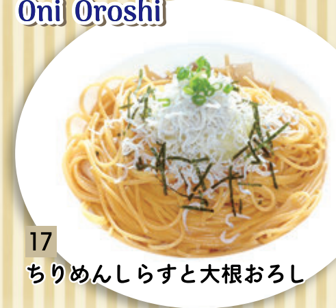
17 ちりめんしらすと大根おろし ¥1,273 (税込 ¥1,400)