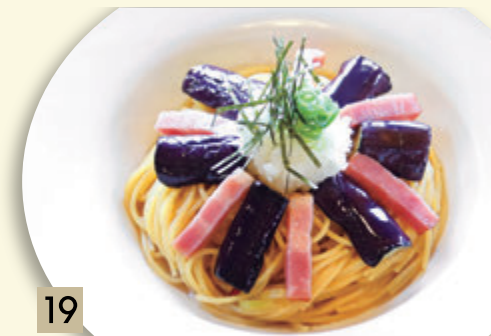
19 なすとベーコンと大根おろし ¥1,319 (税込 ¥1,450)