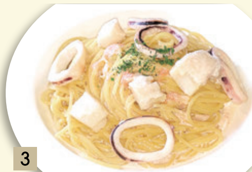
3 ホタテとイカの 明太子クリームソース ¥1,637 (税込 ¥1,800)