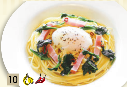
10 🧄🌶️ とろとろ卵とベーコンの ペペロンチーノ ¥1,273 (税込 ¥1,400)