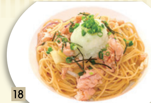
18 スモークサーモンと大根おろし ¥1,410 (税込 ¥1,550)