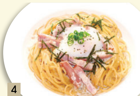
4 とろとろ卵とベーコンの 明太子和風カルボナーラ ¥1,500 (税込 ¥1,650)