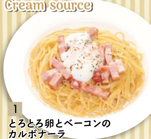
1 とろとろ卵とベーコンの カルボナーラ ¥1,455 (税込 ¥1,600)