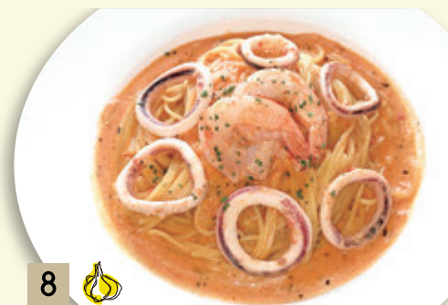
8 🧄 海老とイカの トマトクリームソース ¥1,500 (税込 ¥1,650)