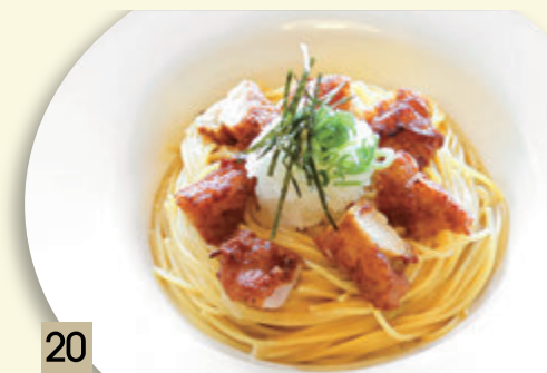
20 チキン唐揚げと大根おろし ¥1,228 (税込 ¥1,350)