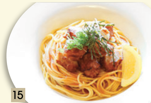
15 チキン唐揚げの明太子和風 ¥1,273 (税込 ¥1,400)