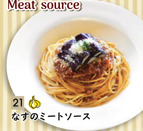
21 🧄 なすのミートソース ¥1,364 (税込 ¥1,500)