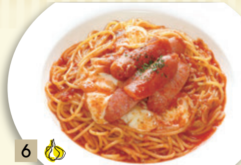
6 🧄 ソーセージとモッツアレラの トマトソース ¥1,364 (税込 ¥1,500)