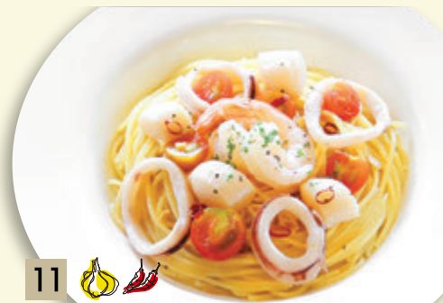
11 🧄🌶️ 海の幸のアーリオ・オーリオ ¥1,591 (税込 ¥1,750)