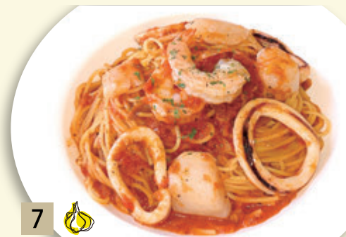
7 🧄 海の幸のペスカトーレ ¥1,637 (税込 ¥1,800)