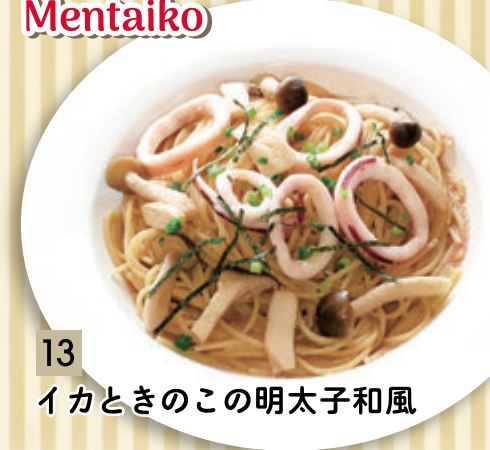
13 イカときのこの明太子和風 ¥1,364 (税込 ¥1,500)