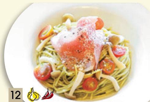
12 🧄🌶️ 生ハムとフレッシュトマトの ジェノベーゼ ¥1,500 (税込 ¥1,650)