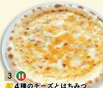
3 H 🍷 4種のチーズとはちみつ ¥926 (税込 ¥1,000)