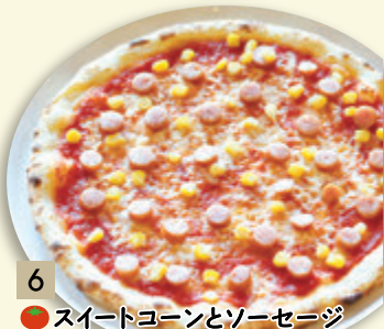
6 ● スイートコーンとソーセージ ¥926 (税込 ¥1,000)