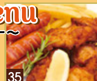
35 おつまみミックス フライドポテト・チキン唐揚げ・ あらびきソーセージ ¥1,019 (税込 ¥1,100)