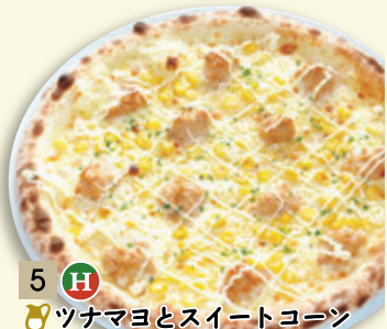
5 H 🍷 ツナマヨとスイートコーン ¥880 (税込 ¥950)