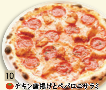
10 ● チキン唐揚げとペパロニサラミ ¥880 (税込 ¥950)