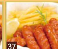
37 あらびきソーセージ & フライドポテト ¥649 (税込 ¥700)