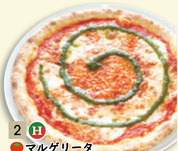
2 H ● マルゲリータ ¥926 (税込 ¥1,000)