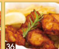
36 チキン唐揚げ & フライドポテト ¥649 (税込 ¥700)