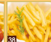
38 フライドポテト ¥417 (税込 ¥450)