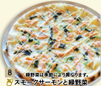
8 緑野菜は季節により異なります。 🍷 スモークサーモンと緑野菜 ¥1,112 (税込 ¥1,200)