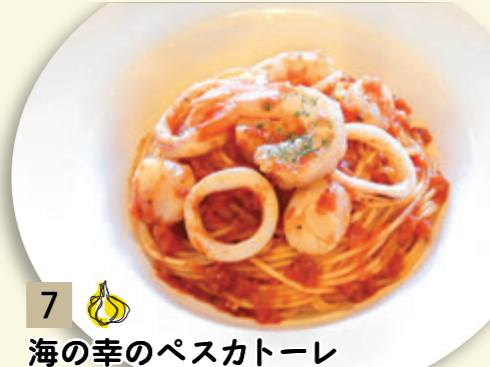
7 海の幸のペスカトーレ ¥1,182 (税込 ¥1,300)