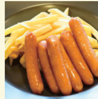
47 あらびきソーセージ & フライドポテト ¥637 (税込 ¥700)