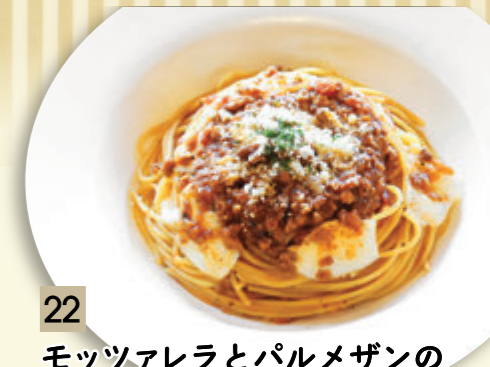
22 モッツアレラとパルメザンの ミートソース ¥955 (税込 ¥1,050)