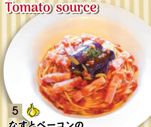
5 なすとベーコンの トマトソース ¥864 (税込 ¥950)