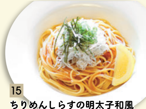
15 ちりめんしらすの明太子和風 ¥819 (税込 ¥900)