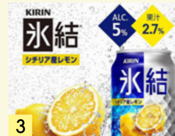
3 レモンサワー ¥273 (税込 ¥300)