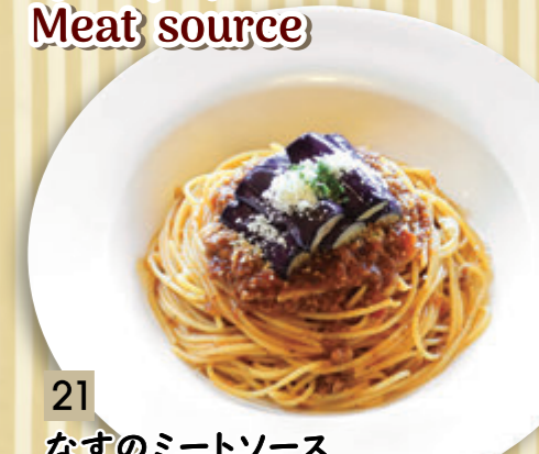
21 なすのミートソース ¥910 (税込 ¥1,000)