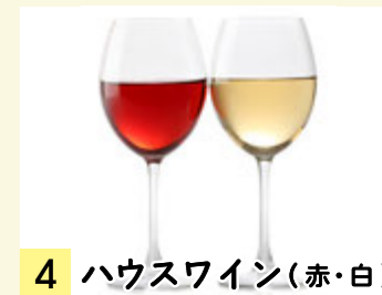
4 ハウスワイン(赤・白) グラス ¥273 (税込 ¥300) デキャンタ ¥637 (税込 ¥700)