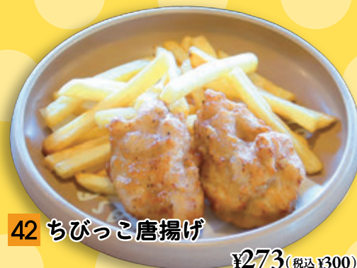
42 ちびっこ唐揚げ ¥273 (税込 ¥300)