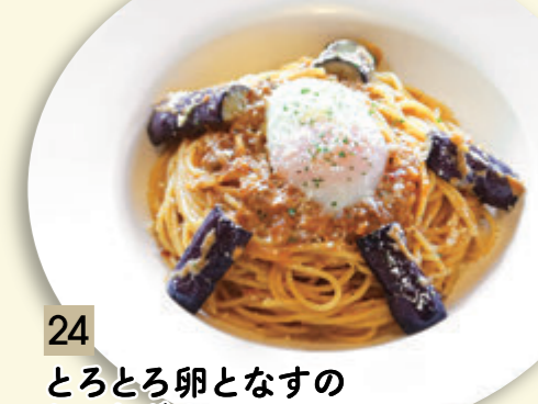
24 とろとろ卵となすの ミートボナーラ(ミート+クリーム) ¥955 (税込 ¥1,050)

にんにく入り にんにく、とうがらし入り ★にんにく、とうがらしの量はお好みに応じます。