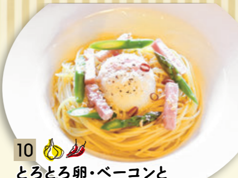
10 とろとろ卵・ベーコンと グリーンアスパラのペペロンチーノ ¥819 (税込 ¥900)