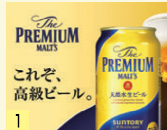
1 生ビール(缶) ¥364 (税込 ¥400)