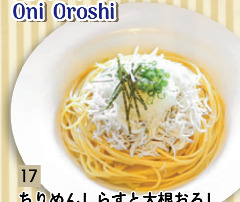
17 ちりめんしらすと大根おろし ¥819 (税込 ¥900)