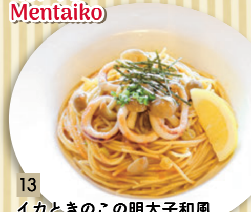
13 イカときのこの明太子和風 ¥864 (税込 ¥950)