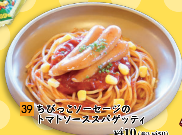
39 ちびっこソーセージの トマトソーススパゲッティ ¥410 (税込 ¥450)