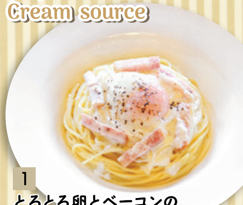
1 とろとろ卵とベーコンの カルボナーラ ¥1,000 (税込 ¥1,100)