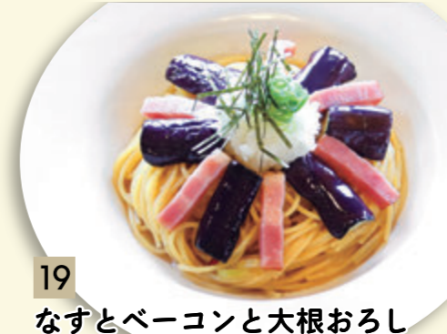
19 なすとベーコンと大根おろし ¥819 (税込 ¥900)