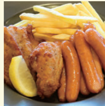
45 おつまみミックス (フライドポテト・チキン唐揚げ・ あらびきソーセージ) ¥1,000 (税込 ¥1,100)