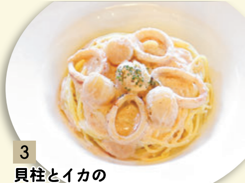
3 貝柱とイカの 明太子クリームソース ¥1,182 (税込 ¥1,300)