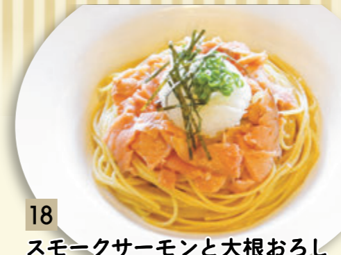
18 スモークサーモンと大根おろし ¥910 (税込 ¥1,000)