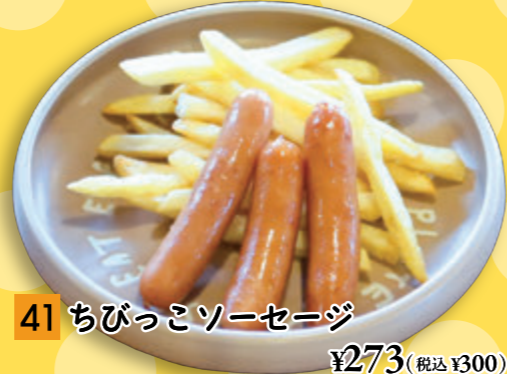
41 ちびっこソーセージ ¥273 (税込 ¥300)