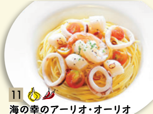
11 海の幸のアリオ・アリオ ¥1,182 (税込 ¥1,300)