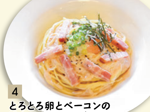
4 とろとろ卵とベーコンの 明太子和風カルボナーラ ¥1,046 (税込 ¥1,150)