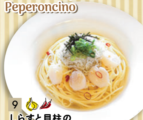
9 しらすと貝柱の ペペロンチーノ ¥955 (税込 ¥1,050)