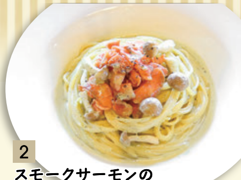
2 スモークサーモンの バジルクリームソース ¥1,137 (税込 ¥1,250)