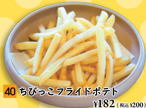
40 ちびっこフライドポテト ¥182 (税込 ¥200)