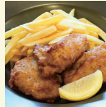
46 チキン唐揚げ & フライドポテト ¥637 (税込 ¥700)