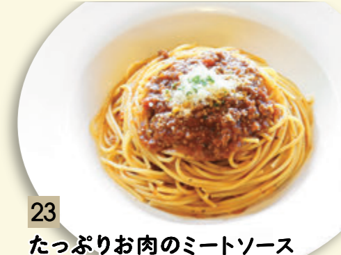
23 たっぷりお肉のミートソース ¥773 (税込 ¥850)