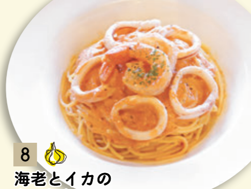
8 海老とイカの トマトクリームソース ¥1,046 (税込 ¥1,150)