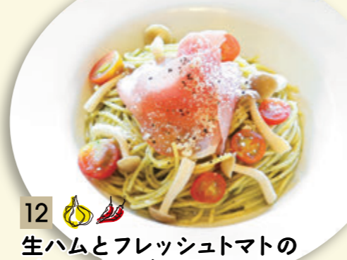
12 生ハムとフレッシュトマトの ジェノベーゼ ¥1,046 (税込 ¥1,150)