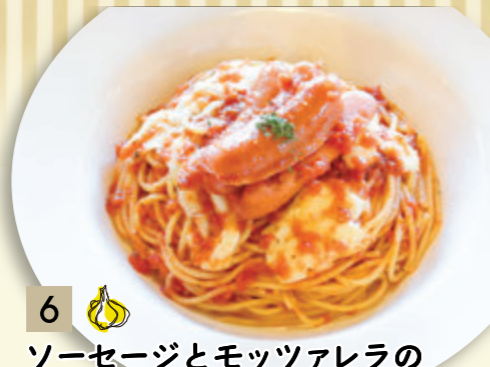
6 ソーセージとモッツアレラの トマトソース ¥910 (税込 ¥1,000)