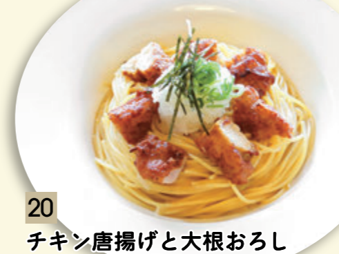
20 チキン唐揚げと大根おろし ¥773 (税込 ¥850)