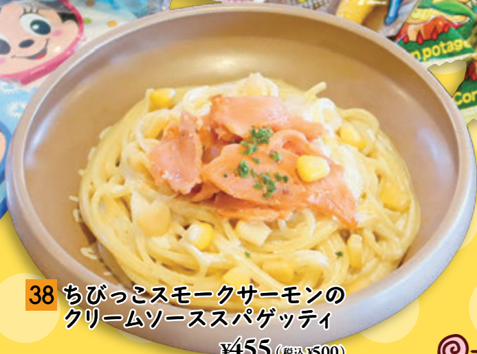
38 ちびっこスモークサーモンの クリームソーススパゲッティ ¥455 (税込 ¥500)