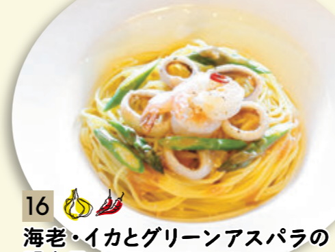
16 海老・イカとグリーンアスパラの 明太子ペペロンチーノ ¥1,046 (税込 ¥1,150)