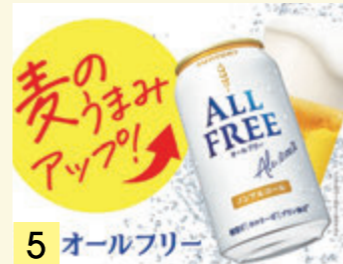
5 オールフリー ノンアルコールビール ¥273 (税込 ¥300)