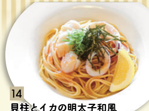
14 貝柱とイカの明太子和風 ¥1,091 (税込 ¥1,200)