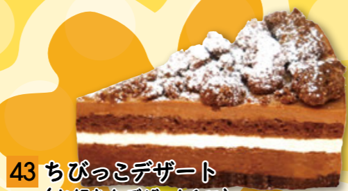
43 ちびっこデザート (お好きなデザート1種) ¥137 (税込 ¥150)